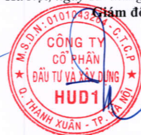
Dương Tất Khiêm