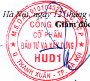
Dương Tất Khiêm