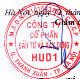
Dương Tất Khiêm