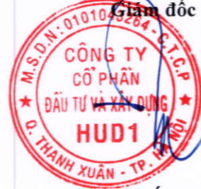
Đương Tất Khiêm